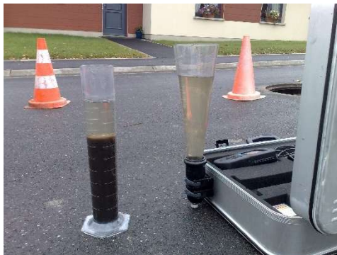
Mesure du volume de boues activées dans le SBR (à gauche) Mesure des matières décantables de la bouteille d'échantillonnage avec cône Imhof (à droite)