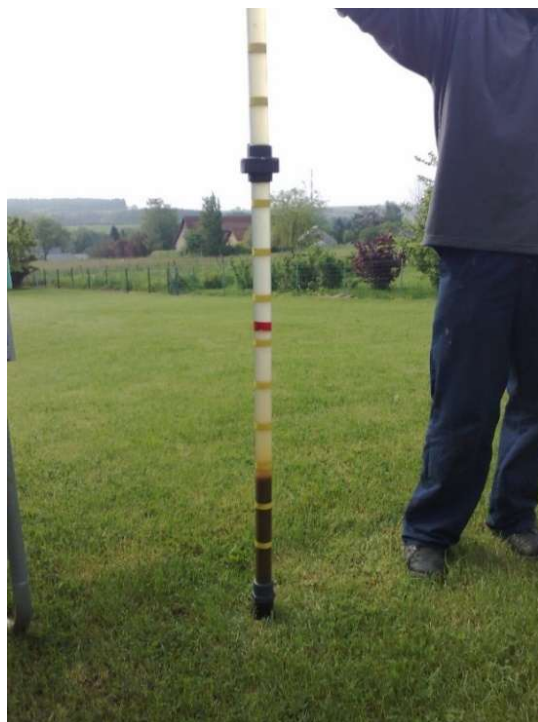
Mesure de niveau de boues dans le décanteur primaire

Lors de l'entretien de l'unité d'épuration individuelle effectué par un prestataire d'entretien agréé par ATB, celui-ci effectue un carottage dans le décanteur primaire.